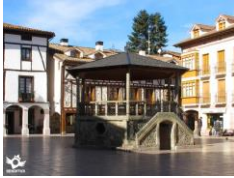
Ezcaray, La Rioja