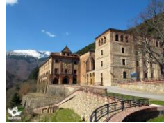
Monasterio de Valvanera Anguiano, La Rioja

Esta ruta ha sido realizada sobre el terreno por SENDITUR el 21-05-2015 la ruta puede variar mucho en función de la época del año y de las condiciones meteorológicas. SENDITUR no se responsabiliza de cualquier mal uso de sus guías y recomienda que cada uno sea responsable y prudente en la realización de la actividad. La ruta ha sido realizada sobre el terreno por SENDITUR. Igualmente, te invitamos a documentarte con guías especializadas y libros para complementar la información descrita. Todos los tiempos son efectivos y toman un carácter orientativo, no se han tenido en cuenta las paradas. Antes de realizar cualquier ruta, valora tus conocimientos técnicos, tu forma física, infórmate sobre la meteorología y las variaciones que hubiera podido sufrir la ruta, equípate correctamente, sé prudente y responsable en todo momento, no sobrepasando tus capacidades. Desde el compromiso de SENDITUR con la Naturaleza y el respeto al equilibrio del medioambiente, SENDITUR te insta a viajar de una forma responsable, con bajo impacto ambiental y respetando en todo momento el entorno Natural, Cultural y Social de allí por donde pases. Para cualquier sugerencia, SENDITUR te invita a enviar un correo a info@senditur.com .