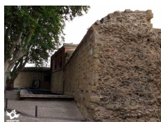
Logroño, La Rioja

La etapa puede variar mucho en función de la época del año y de las condiciones meteorológicas. SENDITUR no se responsabiliza de cualquier mal uso de sus guías y recomienda que cada uno sea responsable y prudente en la realización de la actividad. La ruta ha sido realizada sobre el terreno por SENDITUR. Igualmente, te invitamos a documentarte con guías especializadas y libros para complementar la información descrita. Todos los tiempos son efectivos y toman un carácter orientativo, no se han tenido en cuenta las paradas. Antes de realizar cualquier ruta, valora tus conocimientos técnicos, tú forma física, infórmate sobre la meteorología y las variaciones que hubiera podido sufrir la ruta, equípate correctamente, sé prudente y responsable en todo momento, no sobrepasando tus capacidades. Desde el compromiso de SENDITUR con la Naturaleza y el respeto al equilibrio del medioambiente, SENDITUR te insta a viajar de una forma responsable, con bajo impacto ambiental y respetando en todo momento el entorno Natural, Cultural y Social de allí por donde pases. Para cualquier sugerencia, SENDITUR te invita a enviar un correo a info@senditur.com .