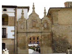
Los Arcos, Navarra