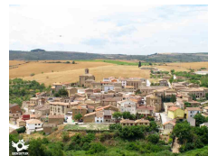
Torres del Río, Navarra